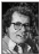
Par JM. FAYE