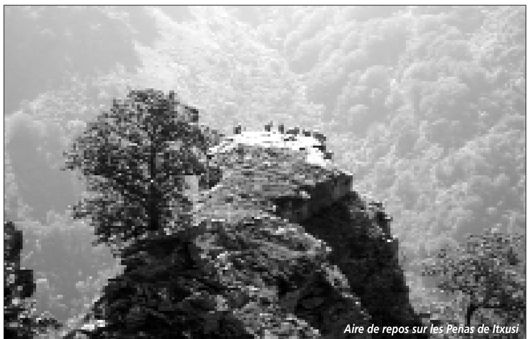
Aire de repos sur les Peñas de Itxusi