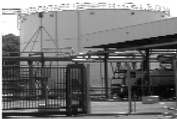
Raffinerie du Midi à Boucau... ou le « Guantanamo du Bas Adour »

de présenter et expliquer les mesures inéluctables ainsi que les choix possibles : carte de zonage brut qui permettront de prescrire des solutions (modification du PLU, expropriation, délaissement, préemption).