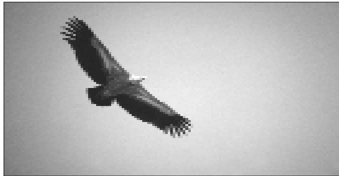
Les vautours (accipitridés) sont des oiseaux « rapaces » au régime essentiellement nécrophage.

« L'attaque » perpétrée dans la petite commune bas-navarraise par une bande (organisée ?) de pas moins de 150 vautours, selon les témoins, et surtout ses suites médiatico-politiques posent une fois de plus la question des rapports entre l'homme et la nature, le civilisé et le sauvage.